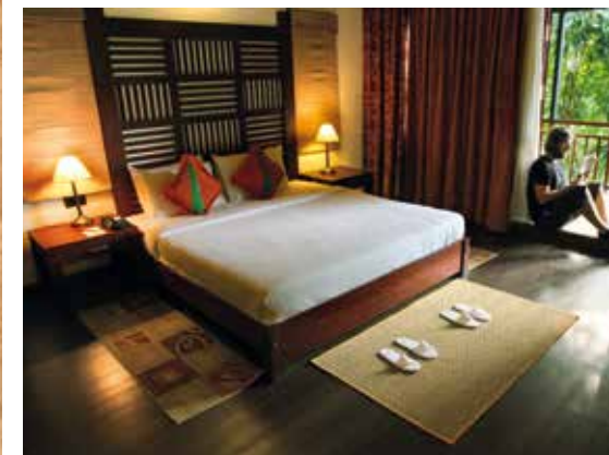
▲ TRETOPP: På Vythiri Resort kan du realisere drømmen om å bo helt i toppen av et tre, ellers sjekke inn på nydelig bungalow på litt fastere grunn.