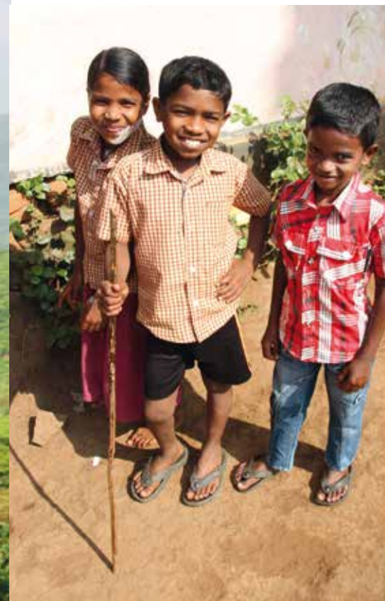
▲ PICTURE, PLEASE!: Barna blir ivrige når vi spør om å ta bilde. Og svært lattermilde når de får se resultatet på skjermen.

– Jeg elsker livet her oppe. Det er avslapning, men samtidig spennende. Men vi må